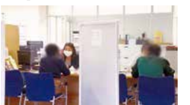
相談窓口で聞き取りにあたる支援員たち

コロナ禍のいま、雇い止めや生活困窮などによって支援の窓口を訪れたことをきっかけに、自分の障害に気づくケースが相次いでいます。「クローズアップ現代+」2020年11月10日放送の、「なぜ今も多くの人が? 気づかれない大人の障害」では、障害者手帳の有無などにかかわらず、「生きづらさを抱えている人なら誰でも」就労支援するという条例を定めた静岡県の自治体として、富士市のユニバーサル就労支援センターが取り上げられました。多様性のある社会を目指した地域作りへの挑戦は続きます。